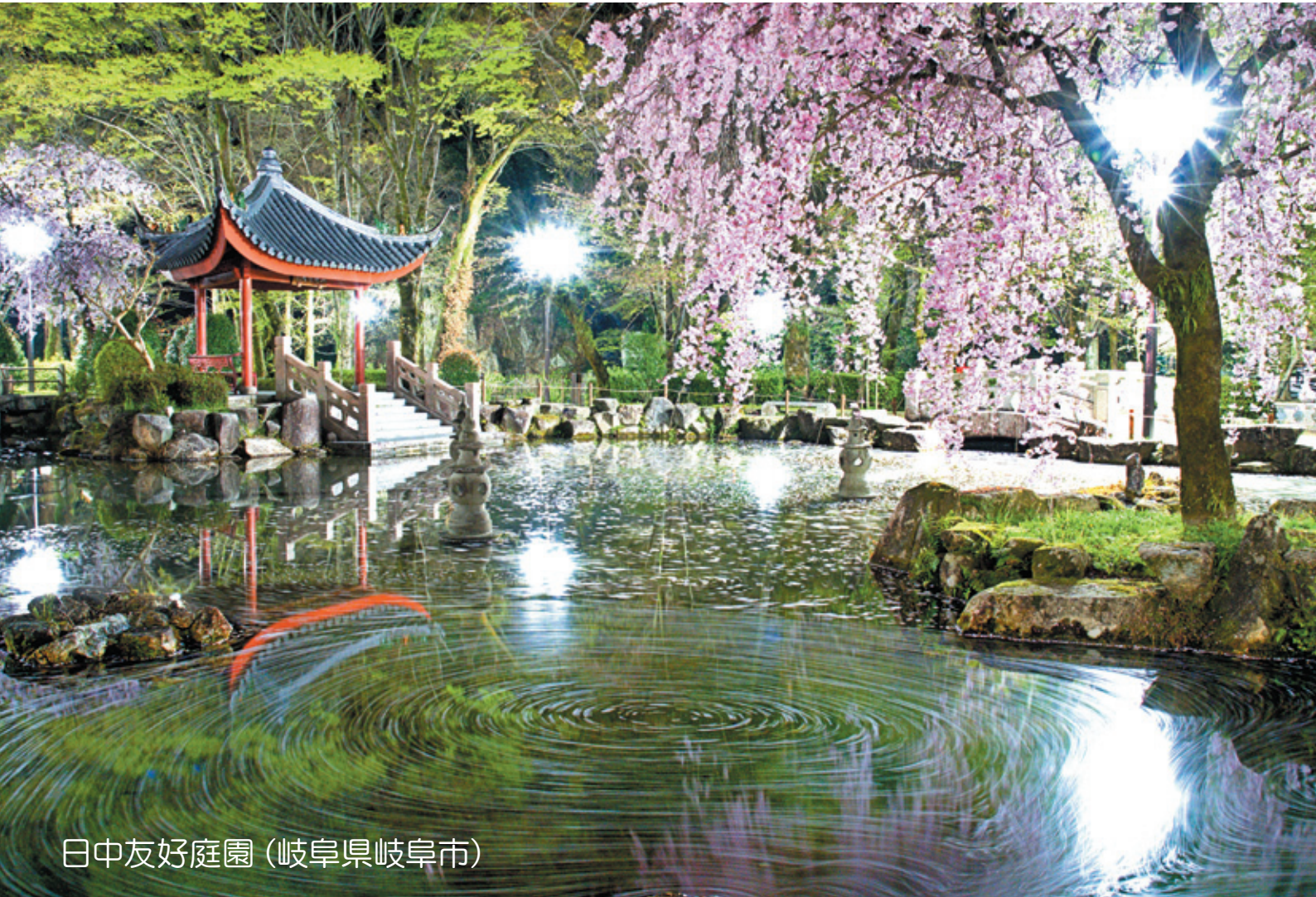
日中友好庭園（岐阜県岐阜市）